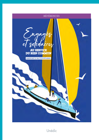
Rapport d'activité 2020