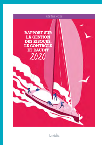
Rapport sur la gestion des risques, le contrôle et l'audit 2020

Unédic – 4, rue Traversière – 75012 Paris – Tél. : 01 44 87 64 00